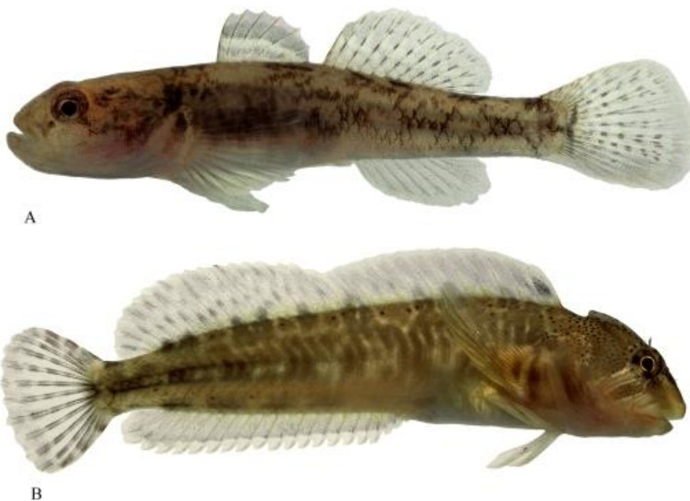
Figure 3 : A. ghiozzo. B. blennie fluviatile.

Apparentée à la grande alose et au cheppia, espèces éteintes en Suisse, l'agone, tout comme le ghiozzo et la cagnetta (figure 3), n'ont pas de représentant de leur genre dans le nord de la Suisse. Toutes les espèces méridionales dont la situation au regard des menaces pesant sur leur survie a été déterminée par des études figurent malheureusement sur la liste rouge et sont classées « en péril » (3) ou « gravement en péril » (2), voire, dans le cas de la truite marbrée et de la savetta, « menacées d'extinction » (1).