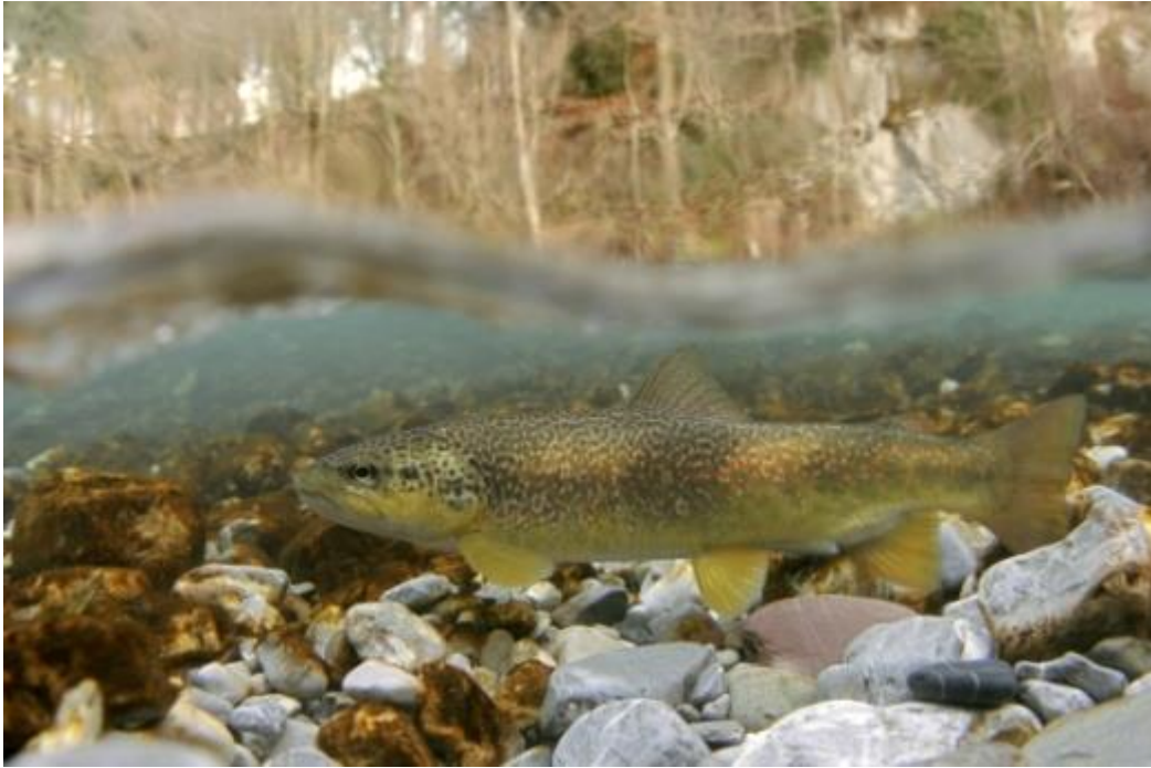
Figure 2 : truite marbrée.

Apparentée à la grande alose et au cheppia, espèces éteintes en Suisse, l'agone, tout comme le ghiozzo et la cagnetta (figure 3), n'ont pas de représentant de leur genre dans le nord de la Suisse. Toutes les espèces méridionales dont la situation au regard des menaces pesant sur leur survie a été déterminée par des études figurent malheureusement sur la liste rouge et sont classées « en péril » (3) ou « gravement en péril » (2), voire, dans le cas de la truite marbrée et de la savetta, « menacées d'extinction » (1).