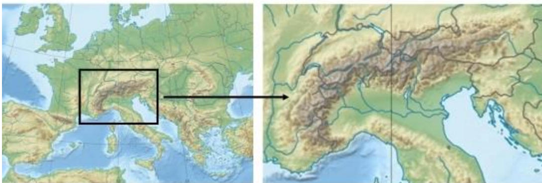
Figure 1 : carte de l'Europe avec agrandissement du nord du bassin de l'Adriatique. Carte physique de l'Europe, auteur : Alexrk2, Wikimedia Commons, licence CreativeCommons by-sa-3.0-de

C'est dans ce bassin qu'est situé le canton du Tessin, dans lequel on trouve une faune ichtyologique unique dont les caractéristiques se différencient nettement de celle du reste de l'Europe. Beaucoup de poissons d'eau chaude vivent uniquement dans cette région. En revanche, beaucoup d'espèces, principalement des poissons d'eau froide très répandus dans les bassins situés au nord des Alpes, en sont absents.